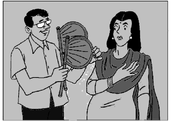
వీరకండిషనర్ కొంటే ఈ రెండు వినినికర్రలూ ఫ్రీగా ఇచ్చారే!