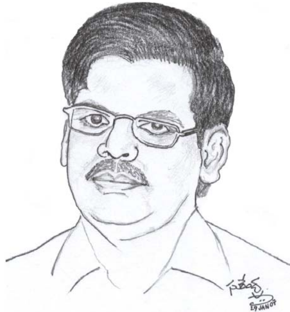
బలకు అసిన సతిపెన్నెల ఈ సీతామణికి ఆత్రేయిత రచనల్లో కావాలి కట్టిన మేక్రి