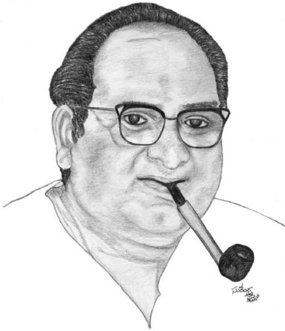
తెలుగు ఆత్రేయ సమర్థం మత్తెళ్ళం రంగాలను అప్పుడేమో ఆత్రేయి ఎన్నోటికి మరపుకొను

breathed his last at his feet. His last words were these, said Buddha, "I trust the people of Hyderabad. I know they will not leave the situation as it is. I am sure they will fight out terrorism. I request my fellow doggie friends to join the C.B.I. and other departments where we can serve as honest, loyal sniffer dogs. We should help our friends, human beings to fight terror. The incidents today inspired me and hope my realization inspires others . Jaihind"